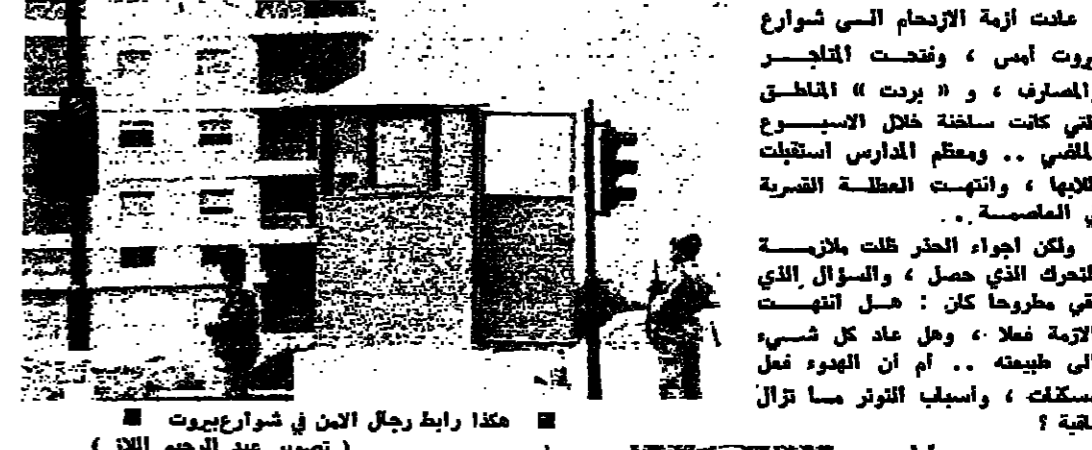
هكذا رايت رجال الفن في شوارع بيروت

عدت ازمة الازحام التي شوارع بيروت امس ، ونفخت القلندر والاصراف ، و « برت » الماطق التي كانت سائفة خلال الاسبوع الماضي .. ومعظم المدارس اسبقت طلابها ، وانتهت العطلة القسرية في العاصمة .. ولكن اجواء الحزن ظلت ملازمة للتحرك الذي حصل ، والسؤال الذي يفتي مطروحا كان : هل انتهت الازمة فعلا ، وهل عاد كل شيء الى طبيعته .. ام ان الهدوء فعل مسكتة ، واسباب التوتر ما تزال باقية ؟